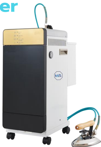
บอยเลอร์ไฟฟ้า MBS