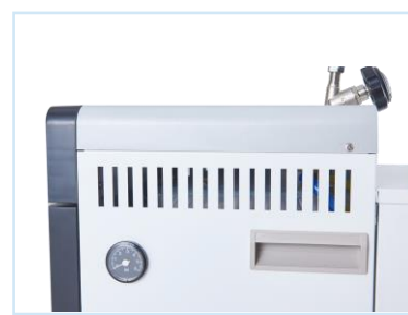
ช่องระบายอากาศ Ventilate the steam