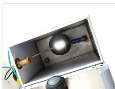
เติมน้ำอัตโนมัติ Add water automatically