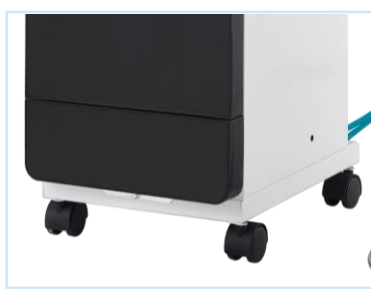
ล้อเลื่อนเคลื่อนย้ายได้ Easy to move