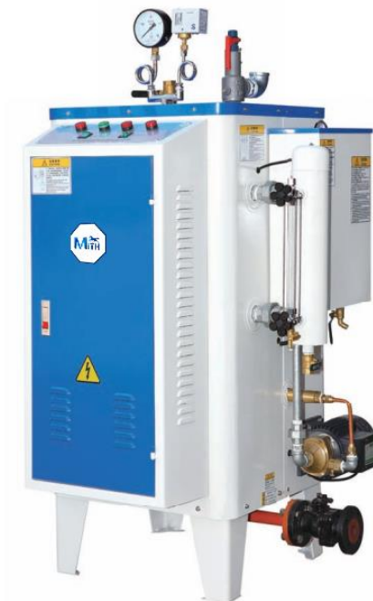
บอยเลอร์ไฟฟ้าอัตโนมัติ MBL