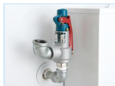
เซฟตี้วาล์ว Safety valve