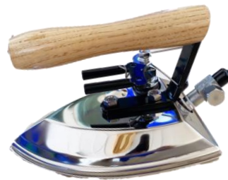
ขนาดผลิตภัณฑ์ Outline dimension

เตารีดไอน้ำล่วน และสายเตารีด ขนาด 200x145 mm น้ำหนัก 1.6 kg