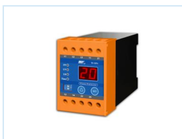
ป้องกันไฟตก ไฟเกิน Phase protector