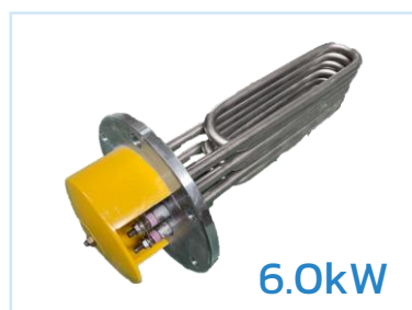
ฮีตเตอร์หน้าแปลน Flange heater